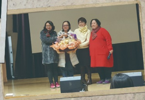
▲ 敬師日水果籃贈送