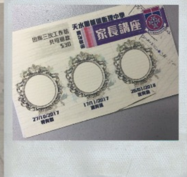
▲家教會講座優惠卡