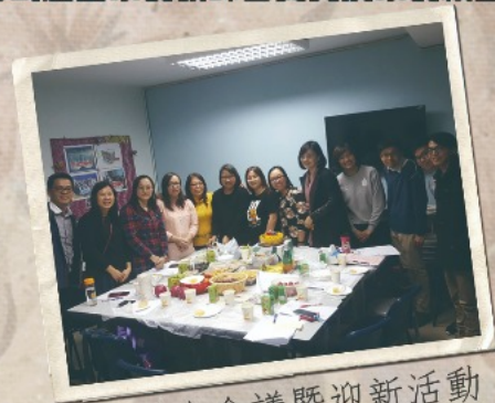
▲家教會會議暨迎新活動