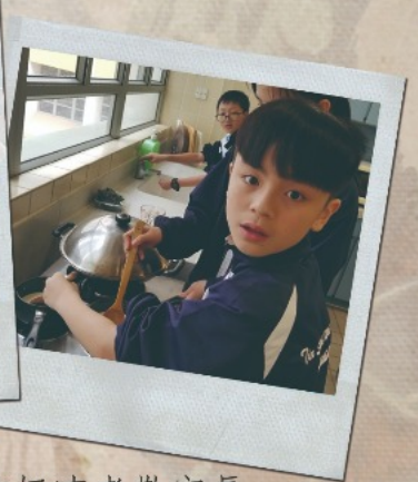
▲ 學生一同製作蜜桃奶凍孝敬家長