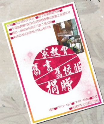
▲舊書及舊校服送贈活動