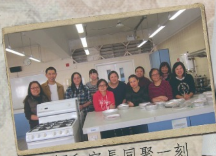
▲老師和家長同聚一刻