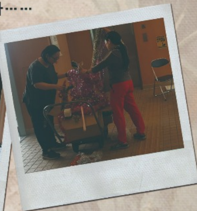
▲家長義工同心協力裝飾校園