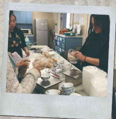
▲ 家長親自泡製糖水慰勞老師