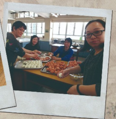
▲ 熟食攤位準備功夫可不少呢！