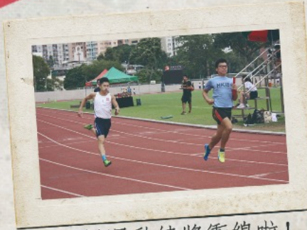
▲天循運動健將衝線啦!