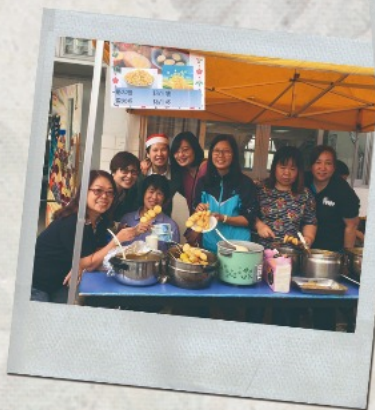
▲家長主理的魚蛋燒賣熟食攤位