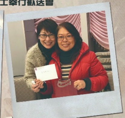
▲校長向家教會主席致送紀念品