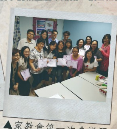
▲家教會第一次會議暨會員就職典禮