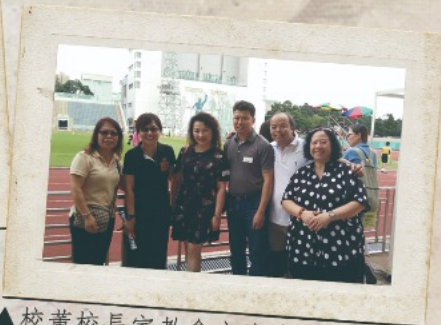
▲校董校長家教會主席我們萬眾一心