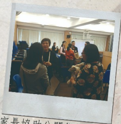
▲家長協助公關組招待小學生