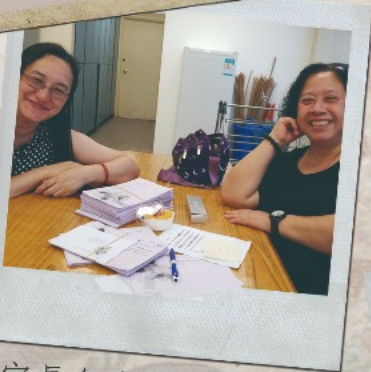
▲ 家長負責篩選感恩信息