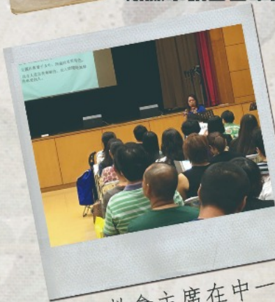
▲家教會主席在中一新生晚會分享