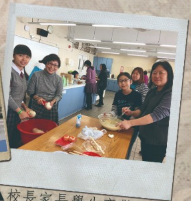
▲校長家長學生齊做年糕