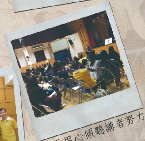
家長用心傾聽講者努力演繹